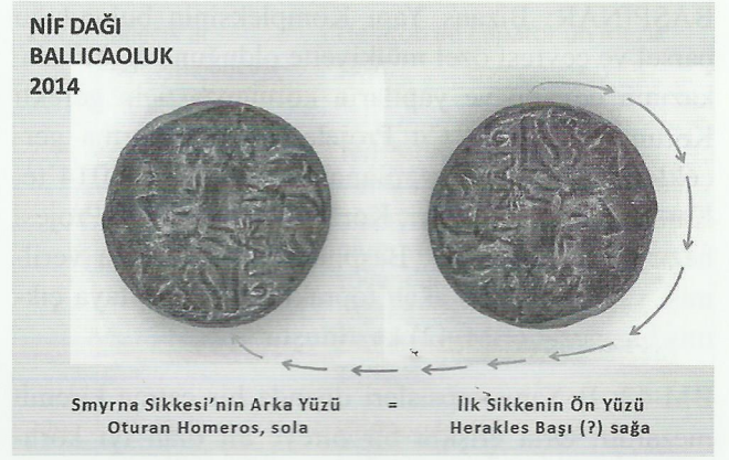
Nif (Olympos) Dağı Kazısı – Nif Dağı Ballıcaoluk: Bronz Smyrna Sikkesi

AD 25 a açmasında küçük taşlarla örülmüş bir duvar ortaya çıkmış; AD 25 c açması içindeki kuzey-güney doğrultulu duvarın, doğu cephesindeki basamakların işlevini anlamak için kazıya devam edilmiş, cephe çizimleri tamamlanmıştır.