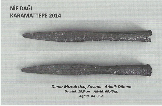
Nif (Olympos) Dağı Kazısı – Nif Dağı Karamattepe: Demir Mızrak Ucu

Kemik eserleriyle ilgi çeken Karamattepe’de, tüm olmasına karşın yanma ve aşınma nedeniyle yüzey kaybına uğradığından, kenar uzunlukları 1,1-1,25 cm arasında değişen geometrik küp formlu ve standarda uygun sayı dizilimli kemik bir zar bulunmuştur. 2012 yılında Karamattepe’de, eşkenar dörtgen prizma biçimli ilginç bir kemik zar gün ışığına çıkmıştı ( bkz. TEBE HABERLER, 35, 2013, s. 39, Resim ).