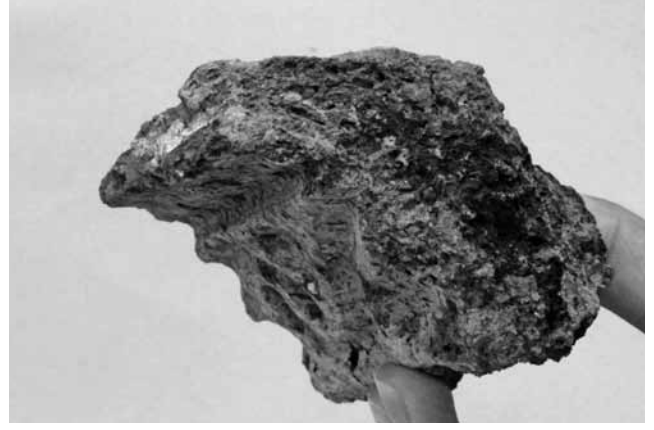
Maydos Kilisetepe Höyüğü Kazıları – ‘Kartonpiyer’ uygulaması olarak düşünülen rölyefli kerpiç parçası

negatif izlerinden anlaşılmaktadır. Ayrıca motif kalınlıkları, kenar ve arkalarındaki izler bu rölyeflerin bir kısmının kerpiç duvarlar üzerinde bordür olarak ve bir kısmının da kapı ve pencerelerde söve olarak kullanıldıklarını düşündürmektedir. Ele geçen rölyefli kerpiç parçaları arasında bir tanesinin hem üst kısmı hem de arka kısmı bir köşeye denk gelecek şekilde düzleştirilmiştir. Bu parçanın duvar ile tavan arasına denk gelen bir yerde, günümüzdeki adıyla kartonpiyer uygulamaları gibi kullanıldığını düşünmekteyiz. Bu buluntu tüm Önasya’da bilinen en eski ‘kartonpiyer’ uygulamasıdır. 2011 kazı sezonunda ağır yangın geçirecek tahrip olmuş dört adet yapı ortaya çıkarıldı. Yapıların içinde rölyefli kerpiç parçalarının yanısıra çok sayıda seramik kap ve küçük buluntu in situ olarak ele geçmiştir.