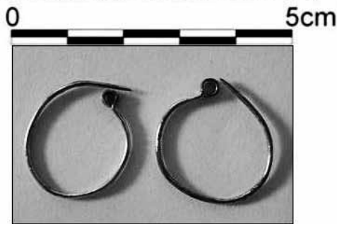
Nif (Olympos) Dağı Kazısı – BM 15 ve gümüş küpeler

aylık bebek bireyin kafatasının iki yanında, kulaklar hizasında, gümüş telden iki halka küpe bulunmuştur.