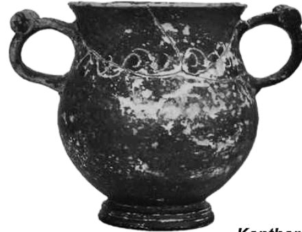
Kantharos "Batı Yamacı Stili"