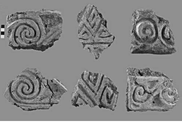
Maydos Kilisetepe Höyüğü Kazıları – Ele geçen rölyefli kerpiç kalıntıları