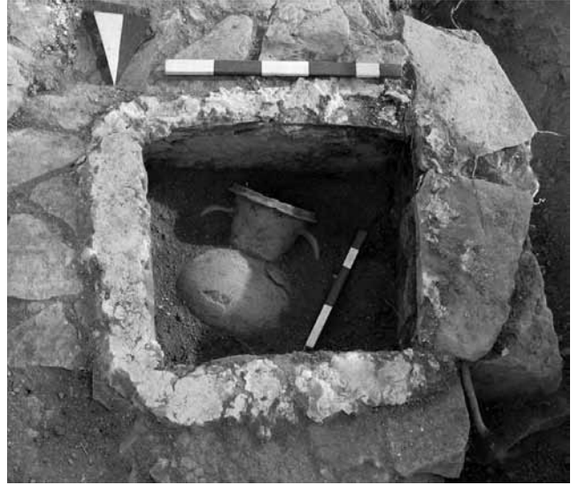
Nif – Karamattepe 6 numaralı Mezar