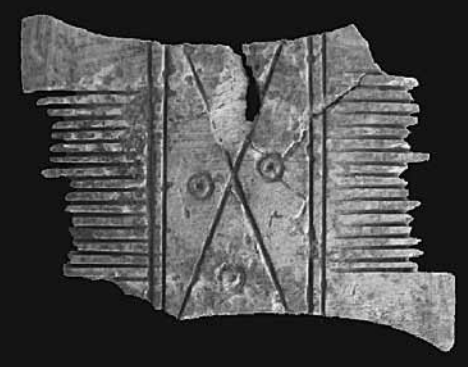
Nif Karamattepe Kemik Tarak

ok ucu TİP 1, sivri dipli, dörtgen kesitlidir; örnekleri demirdendir. Karamattepe’de tüm ok uçları, arazide, güneybatı-batı kesimde bir hat boyunca bulunmuşlardır. Bunların ayrıntılı tarihlenmesine ilişkin analogi çalışmaları sürmektedir.