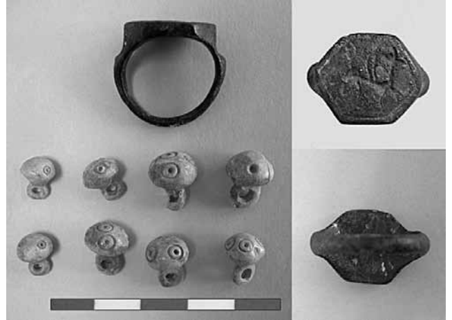
Nif (Olympos) Dağı Kazısı – BM-29 Konteksti: Bronz Yüzük ve Kemik Düğmeler

sıralanmış, muhtemelen tahta ayaklar (tezgâh?) oturulması için açılmış ince uzun dikdörtgen oyuklar, özellikle dikkat çekicidir ve uzun bir düzenek tasarımına işaret etmektedir. Bunlar, iki Metal Ergitme Fırını (Baykan 2013a: 191-204; Baykan 2013b: 157-165) ile ilişkili ahşap işliklere ait olabilirler; çünkü fırınların hemen güneydoğusunda yer almaktadırlar ve çevrelerinde yoğun üretim atığı (cüruf) ile metal obje ele geçmiştir.