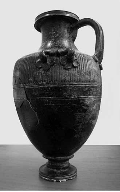
Nif (Olympos) Dağı Kazısı – KM-16 (2012) Pişmiş Toprak Hydria

harfi görülmektedir. Mezarlarda kullanılan kiremitler, genellikle MS 11-12. yy.'a tarihlenmektedir.