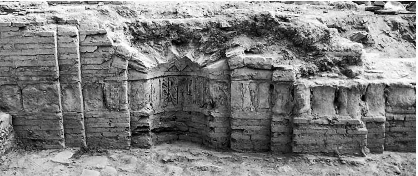
Nif – Başpınar, A ve B Kiliseleri Dış Narteks Cephesi