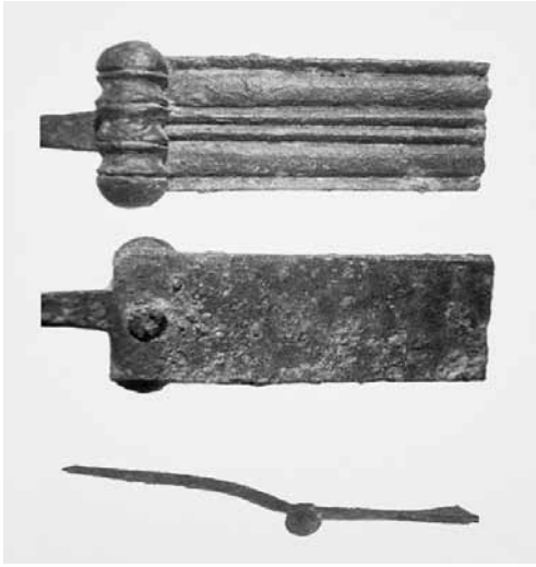
Nif – Karamattepe, MÖ 7.-6. yy Bronz Kemer İğnesi