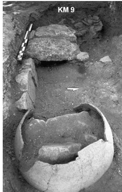
Nif – Karamattepe, KM 9. Hellenistik Dönem’de Mezara Dönüştürülmüş in situ Geometrik/Arkaik Pithos

Ekibimin özveriyle çalışan tüm üyelerine ve Bakanlık temsilcimize içtenlikle teşekkür ederim. Ayrıca, bize çok yardımcı olan, İzmir Valiliği; İzmir İl Kültür ve Turizm Müdürlüğü; İzmir İl Özel İdaresi Kültür-Turizm ve Spor Daire Başkanlığı; Kemalpaşa ve Torbalı Kaymakamlıkları; Kemalpaşa ve Torbalı Belediye Başkanlıkları; Torbalı Tapu ve İmar Müdürlükleri; Dağkızılca ve Vişneli Köyleri Muhtarlıkları; İESOB Birlik Otel ve Güzelyalı Rotaract Kulübü’ndeki ilgili yöneticilere ve çalışma arkadaşlarına içten teşekkür ederiz.